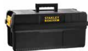
Caja 25" IP54 y asa ergonómica