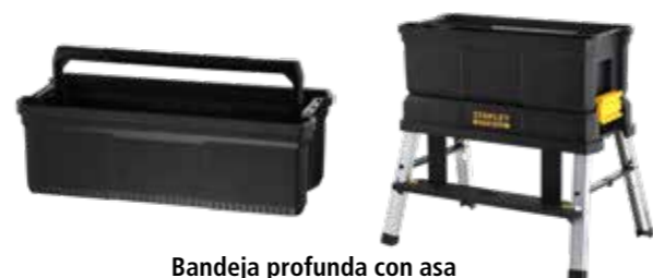
Bandeja profunda con asa Cierres laterales para asegurar al elevador