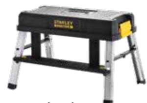
Elevador 150kg de capacidad máxima