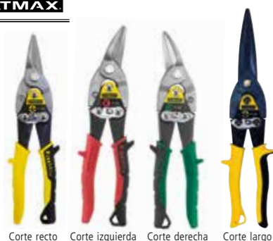
Corte recto Corte izquierda Corte derecha Corte largo