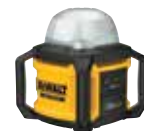
LUZ LED DE ÁREA DCL074