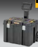
ALMACENAJE MÓVIL TSTAK DWST83347-1