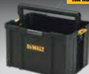
CAJÓN ABIERTO TSTAK DWST1-71228