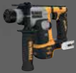
MARTILLO SDS PLUS® 1,4J DCH172NT