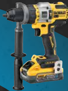
TALADRO PERCUTOR XR 18V XRP POWERSTACK LI-ION 5Ah DCD999H2T-QW 539€