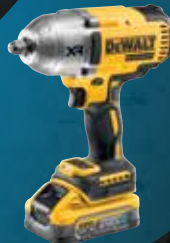
LLAVE DE IMPACTO XR 18V 1/2" 1.356Nm POWERSTACK LI-ION 5Ah DCF900H2T-QW 599€