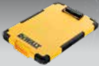
PORTA-DOCUMENTOS TSTAK DWST82732-1