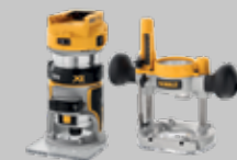
FRESADORA COMBO DCV604NT