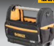
BOLSA ABIERTA TSTAK DWST82990-1