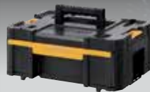
CAJONERA TSTAK III DWST1-70705