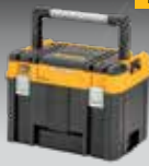
CAJA CON ASA LARGA TSTAK DWST83343-1