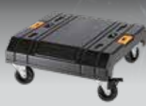
CARRO CON RUEDAS TSTAK DWST1-71229