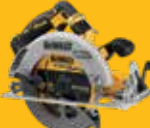
SIERRA CIRCULAR Ø190mm FV ADVANTAGE DCS373NT