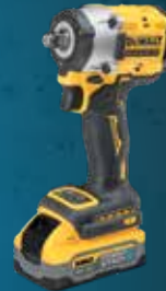
LLAVE DE IMPACTO XR 18V 1/2" 406Nm POWERSTACK LI-ION 5Ah DCF921H2T-QW 489€