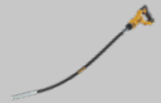
VIBRADOR DE HORMIGÓN DCE531N