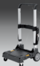
TROLLEY TSTAK DWST1-71196