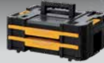
CAJONERA DOBLE TSTAK IV DWST1-70706