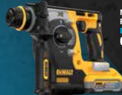
MARTILLO XR 18V SDS plus® 2,1J POWERSTACK LI-ION 5Ah DCH273H2T 649€