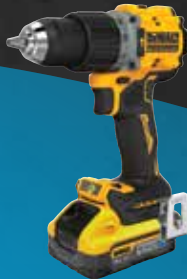
TALADRO PERCUTOR POWERSTACK LI-ION 5Ah DCD805H2T-QW 469€