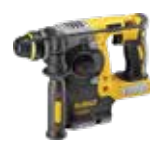
MARTILLO SDS PLUS® 2,1J DCH273N