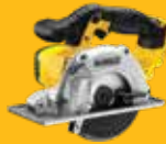
SIERRA MULTICORTE Ø140mm DCS373N