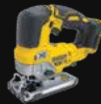
SIERRA DE CALAR DCS334NT