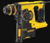
MARTILLO SDS PLUS® 2,1J DCH253N