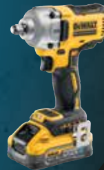
LLAVE DE IMPACTO XR 18V 1/2" 812Nm POWERSTACK LI-ION 5Ah DCF891H2T-QW 529€