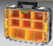
ORGANIZADOR SELLADO TSTAK V DWST82968-1