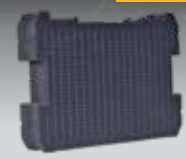
ESPUMA PRE-CORTADA TSTAK DWST1-72364