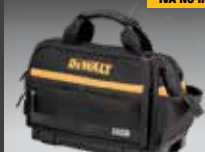
BOLSA CERRADA TSTAK DWST82991-1