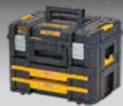
MALETA TSTAK II + CAJONERA DOBLE TSTAK IV DWST83395-1