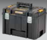
CAJA PROFUNDA TSTAK VI DWST83346-1