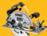
SIERRA CIRCULAR Ø184mm DCS572NT