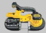
SIERRA DE BANDA 63mm DCS371N