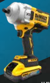
LLAVE DE IMPACTO XR 18V 1/2" 1.632Nm POWERSTACK LI-ION 5Ah DCF961H2T 699€