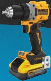
TALADRO ATORNILLADOR POWERSTACK LI-ION 5Ah DCD800H2T-QW 449€

Confiamos tanto en la durabilidad de nuestras baterías POWERSTACK que ofrecemos nuestra garantía de 3 años por primera vez en una batería DEWALT. Aplican términos y condiciones.