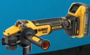
MINI-AMOLADORA XR 18V 125mm POWERSTACK LI-ION 5Ah DCG409H2T-QW 549€